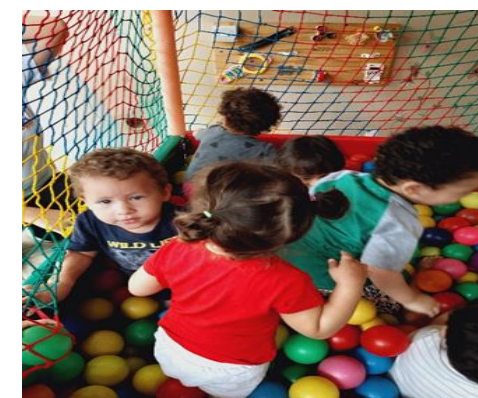
Atividade 3: Explorar