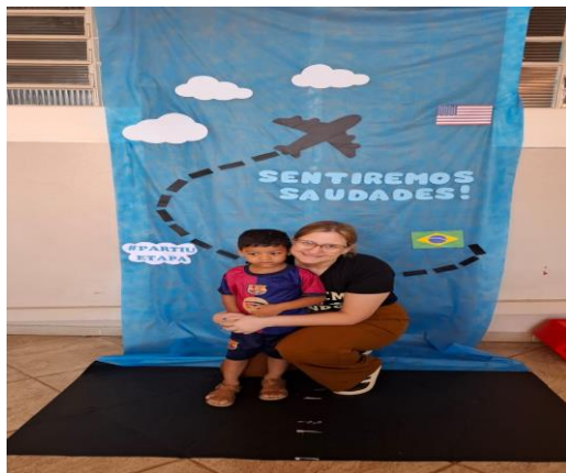
Atividade 1: Conviver

O descritivo de todas as atividades desenvolvidas no mês encontra-se no planejamento, arquivado na Unidade, e disponível para consulta.