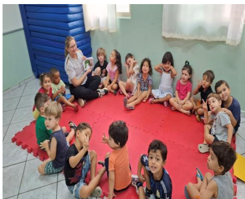
Atividade 2: Participar