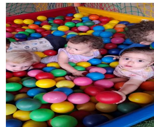
Atividade 5: Conhecer